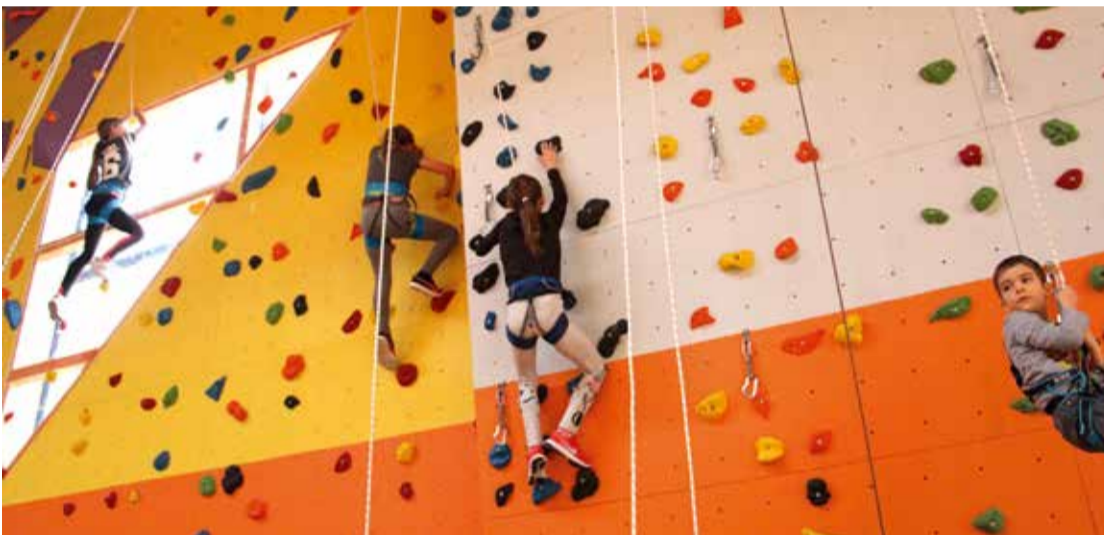
Ścianka wspinaczkowa w Falenicy ponownie czynna