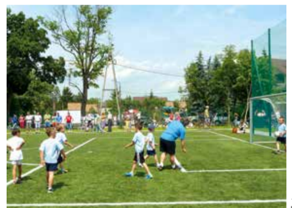
Boisko do piłki nożnej przy Szkole Podstawowej nr 404 w Nadwiślu