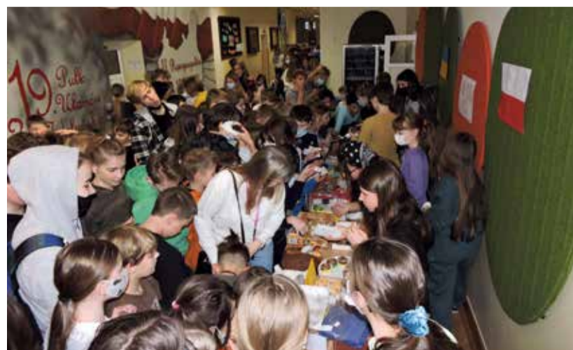
Kiermasz ciast cieszył się dużym zainteresowaniem