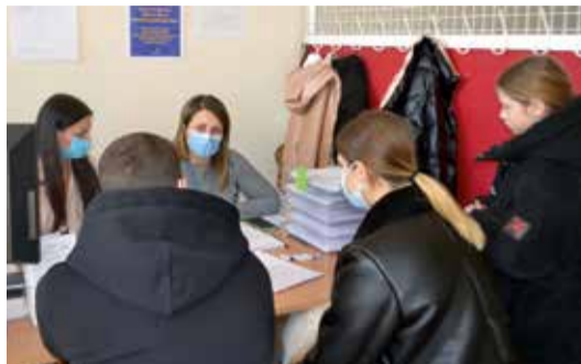
Uchodźcy otrzymują wiele istotnych dla nich informacji w specjalnie utworzonym punkcie w Wawerskim Centrum Kultury

Specjalistyczna Poradnia Rodzinna Dzielnicy Wawer m.st. Warszawy oferuje pomoc psychologiczną dla uchodźców z Ukrainy oraz dla