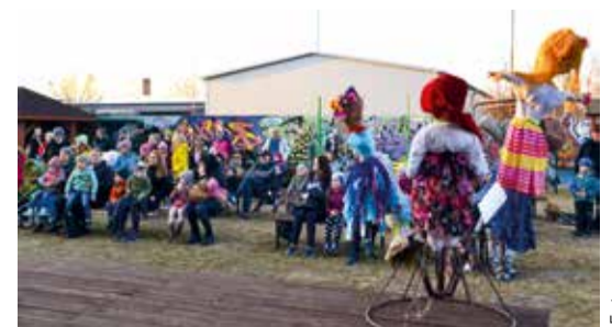
Najwięcej nagrodzonych prac plastycznych wykonały zespoły rodzinne