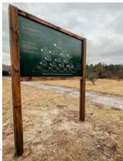
W miejscu przyszłego Parku Aktywności Rodzinnej stoją tablice z koncepcją zagospodarowania terenu

Władze dzielnicy stawiają na rodzinę. Jest to grupa odbiorcza, na której się koncentrują, włączając w nią również seniorów. Park Aktywności Rodzinnej będzie właśnie takim wielopokoleniowym miejscem, które z pewnością odmieni oblicze Wawra. Koncepcja jest