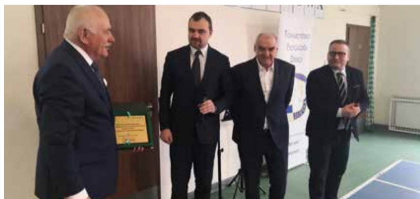
Członkowie Zarządu Dzielnicę przekazali na ręce dyrektora „Helenowa” okolicznościową plakietkę

Do 100-lecia tej placówki będziemy jeszcze wracać przy okazji kolejnych jubileuszowych wydarzeń.