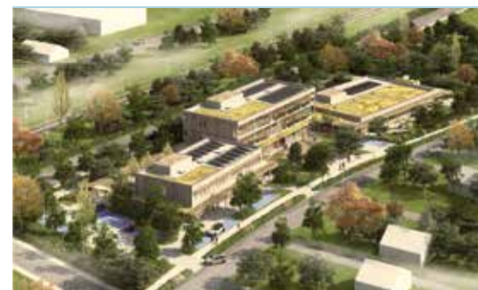
Tak z lotu ptaka będzie wyglądał teren z Centrum Aktywności Międzypokoleniowej

– Mamy dla seniorów wiele propozycji. Organizują je OPS, filie WCK, OSiR. Uruchomiliśmy ostatnio dodatkowe punkty w: Faleniczy, Radości, Aleksandrowie i Marysinie. Odbywają się tam m.in. zajęcia: jogi, wokalne, nordic walking, taniec, rękodzieło, tai chi. Prężnie działa też klub