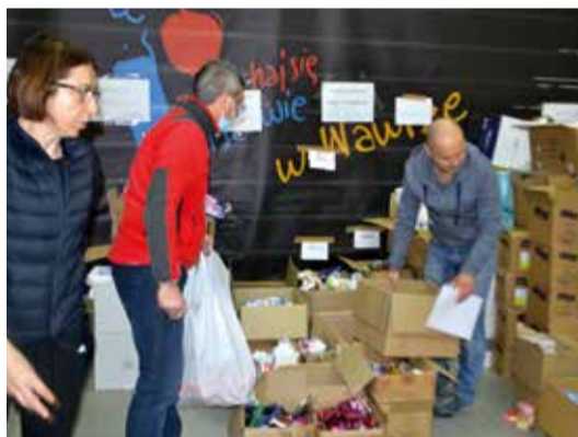
Wolontariusze i pracownicy Urzędu Dzielnicy przygotowują dla Ukraińców paczki żywnościowe i z podstawowymi środkami higienicznymi

osób, które im pomagają. Jest ona przeznaczona dla osób dorosłych i obejmuje maksymalnie 3 konsultacje psychologiczne trwające po 50 minut. Spotkania odbywają się w siedzibie SPR (ul. Włókiennicza 54) i prowadzone są w języku ukraińskim i polskim. Zapisy pod numerem tel. 22 277 11 98, od poniedziałku do piątku, w godz. 8–16. Specjaliści SPR przyjmują także w punkcie pomocy psychologicznej w Wawerskim Ośrodku Wsparcia (ul. Żegańska 2C).