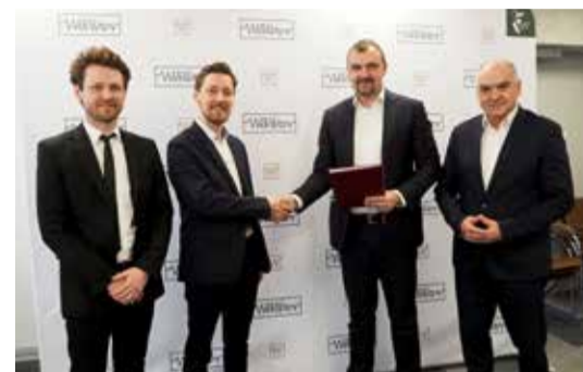
Władze dzielnicy podpisały umowę z autorami najlepszej koncepcji na wykonanie projektu architektonicznego CAM