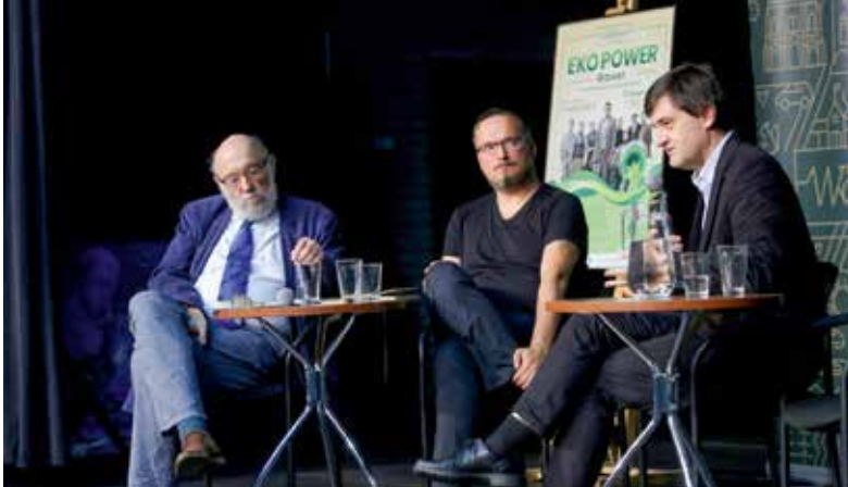
Spokojnej debacie przyszedł czas na wielki piknik i koncerty, które otworzyły władze dzielnicy

Podczas kończącego lato pikniku rodzinnego Ekopower wawerczycy udowodnili, że – po pierwsze – przyroda jest dla nich niezwykle ważna. Po drugie, że chętnie korzystają z atrakcji, które wymagają więcej zaangażowania..