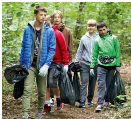
Sprzątaliśmy lasy i uczestniczyliśmy w zielonych warsztatach