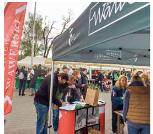
Nasza redakcja też była obecna i chętnie odwiedzana. Furorę robiły krzyżówki

Piknik ekologiczny, który odbył się w sobotę, 17 września, przy Urzędzie Dzielnicy Wawer, przypominał trochę ul. Wrzało w nim, a przy każdym stoisku działały „pracowite pszczołki”, zajęte najróżniejszymi aktywnościami. Budowano domki dla owadów, sadzono kwiaty, robiono kule nasienne dla ptaków dokarmianych zimą, tworzono ekocyflicia do toalet, odbywały się też różnorodne zajęcia plastyczne. Można było posłuchać opowieści leśników z Lasów Miejskich, ciekawostek o pszczelarstwie, poznać zasady efektywności energetycznej, wesprzeć