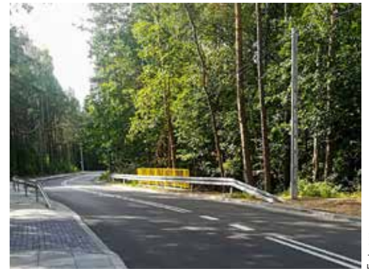
Ulica Trzykrotki, podobnie jak łącząca się z nią ul. Bylicowa, z chodnikiem, mostkiem nad kanałkiem, wyniesionym skrzyżowaniem i spowalniczami

To nie wszystko. W sierpniu rozpoczęło się urządzenie skweru przy Urzędzie Dzielnicy, realizowanego w ramach budżetu obywatelskiego. Jednym z elementów tego miejsca wypoczynku będzie fontanna. Przebudowie ulegnie, po remoncie elewacji, wejście do Wawerskiego Centrum Kultury. Jeszcze we wrześniu ogłoszony ma być przetarg na opracowanie koncepcji pneumatycznej