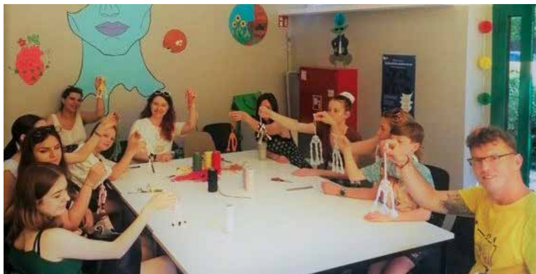
Od maja do lipca odbyło się wiele warsztatów, spotkań, powstał mural. Centrum było w tym okresie bezpieczną przystanią dla ponad 300 młodych ludzi