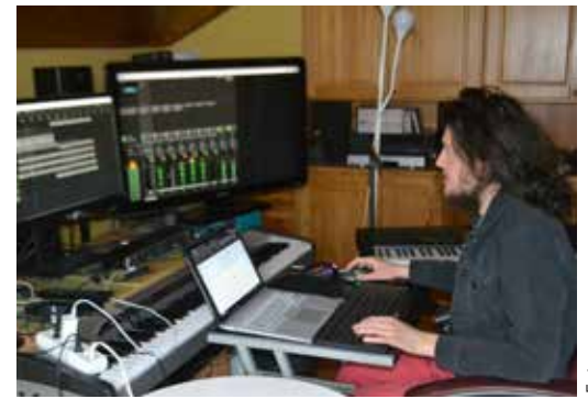
W pełni profesjonalne studio nagrania dźwiękowych, jakie stworzył w domu

W Bydgoszczy studiuje na Wydziale Kompozycji, Teorii Muzyki i Reżyserii Dźwięku. Nie jest łatwo. Nie tak dawno na Facebooku napisał: w sobotę spałem trzy godziny, w niedzielę kolejne trzy i udało mi się zdobyć kolejne zaliczenie . I ten dawniej wycofany młody człowiek, będąc studentem