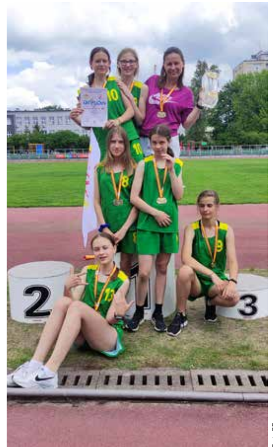
Fot. SP 204