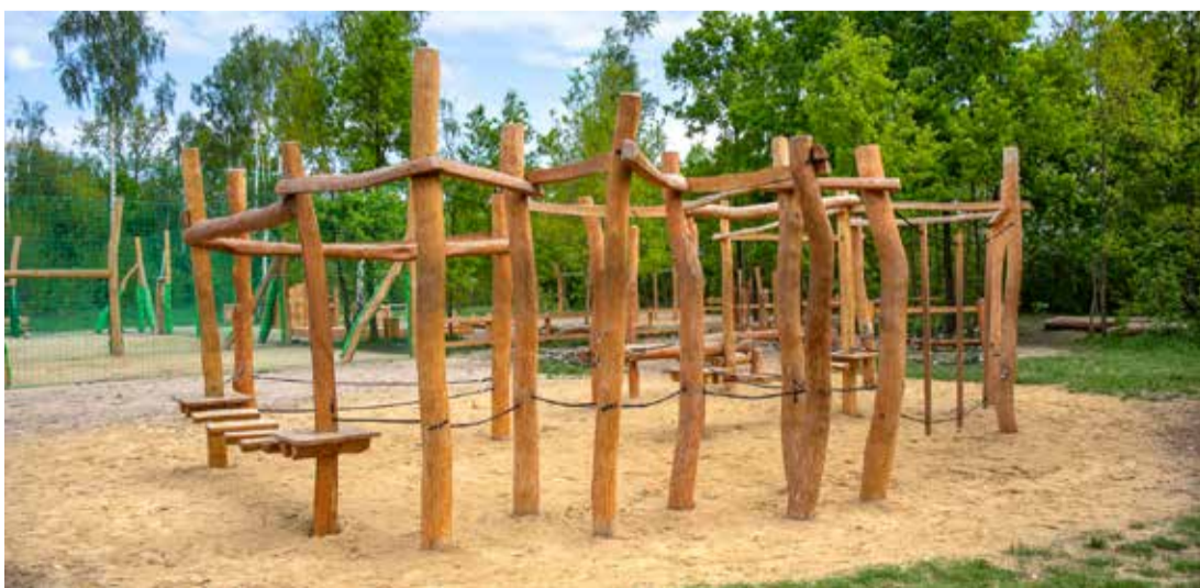
Leśny parkour, boisko i plac zabaw przy ul. Mrówczej to jedna z inwestycji zrealizowanych w ramach budżetu obywatelskiego