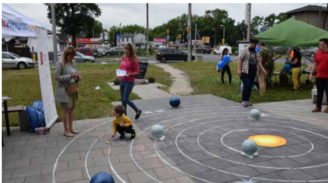
Piknik edukacyjny „Cyber-Wawer” był zorganizowany przez aktywnych mieszkańców dzielnicy w ramach inicjatywy lokalnej