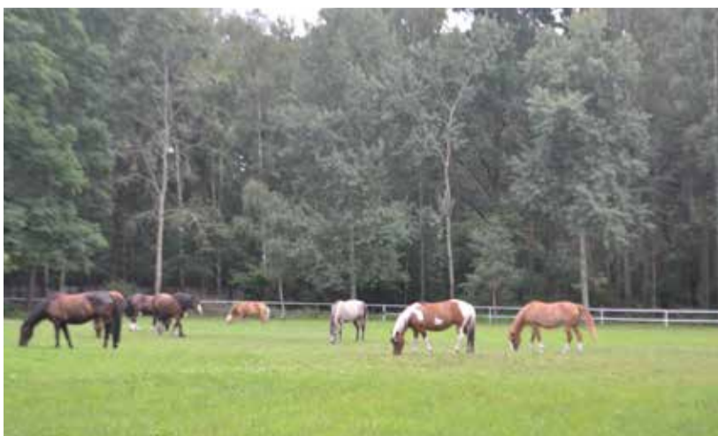
Ośrodek ma własne konie odgrywające ważną rolę w procesach rehabilitacyjnych