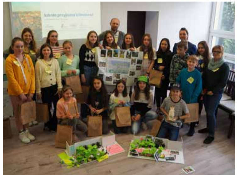
Dzieci bardzo angażowały się w działania warsztatowe i miały wiele ciekawych pomysłów

kwietnych a także parku kieszonkowego. Ponadto ustawione zostaną zbiorniki na deszczówkę. Łącznie na terenie SP nr 195 zostanie zrealizowanych 45 różnych rozwiązań opartych na przyrodzie. Co najważniejsze, wszystkie prace prowadzone będą przy udziale społeczności szkolnej, która już teraz jest angażowana do uczestnictwa w projekcie. Pierwszym zrealizowanym wydarzeniem, było marcowe spotkanie z gro-nem pedagogicznym. Ponadto w kwietniu odbyły się warsztaty, podczas których uczniowie i uczennice zastanawiali się nad przyszłym wyglądem utwardzonego placu znajdującego się przy wejściu do szkoły od ul. Rekruckiej. Uczniowie wskazywali m.in. na konieczność uwzględnienia w projekcie dodatkowych nasadzeń krzewów, drzew i kwiatów. Deklarowali chęć zaangażowania się w prowadzenie ogrodu warzywnego i uczestniczenia w prowadzonych w terenie zieleni lekcjach. Zespół zaangażowanych architektów z JA-Z+Architekci uwzględnił warsztatowe propozycje