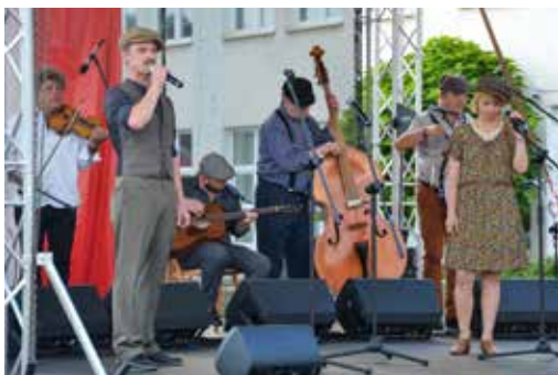
Koncert Warszawiaków wzruszał, bawił i ślaniał do zadumy