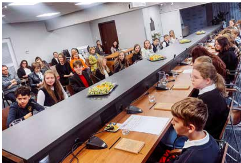
Posiedzenie zarządu z udziałem dzieci

Międzynarodowy Dzień Praw Dziecka, obchodzony 20 listopada w rocznicę uchwalenia Konwencji o prawach dziecka, to radosne święto, ale z poważnym przesłaniem. Taka była też kolorowa manifestacja, w której wzięło udział około kilkuset uczniów i przedszkolaków. W tym roku obchody odbyły się pod hasłem wsparcia dla wszystkich dzieci na świecie, których prawa nie są respektowane. Były głosem przeciw dyskryminacji i za tolerancją. Zachętą do integracji z dziećmi, które