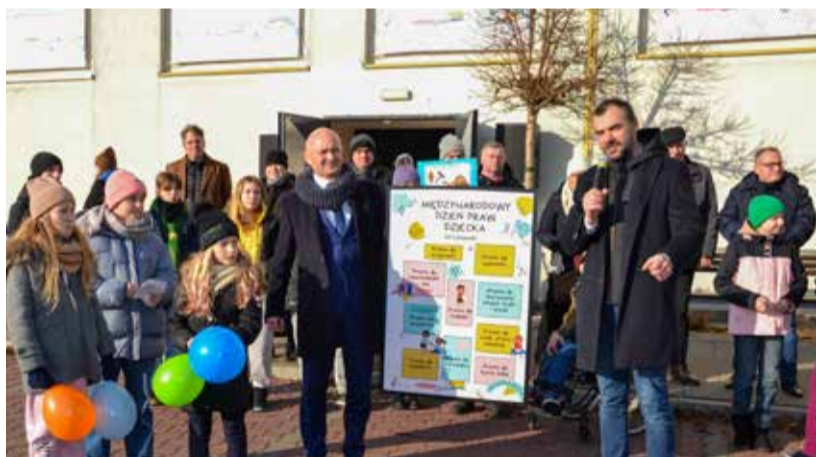
Dzieci wyruszyły z Centrum Zdrowia Dziecka, Specjalnego Ośrodka Wychowawczego TPD „Helenów” i SP nr 138