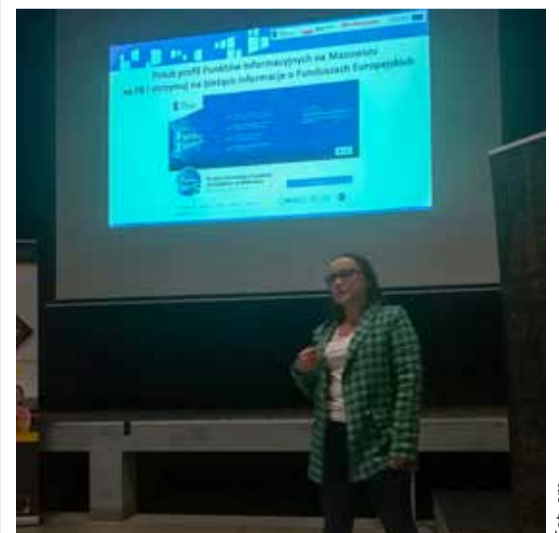
Szkolenia dla wawerskich firm